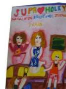
PRÁZDNINOVÝ TÁBOR PRO DĚTI