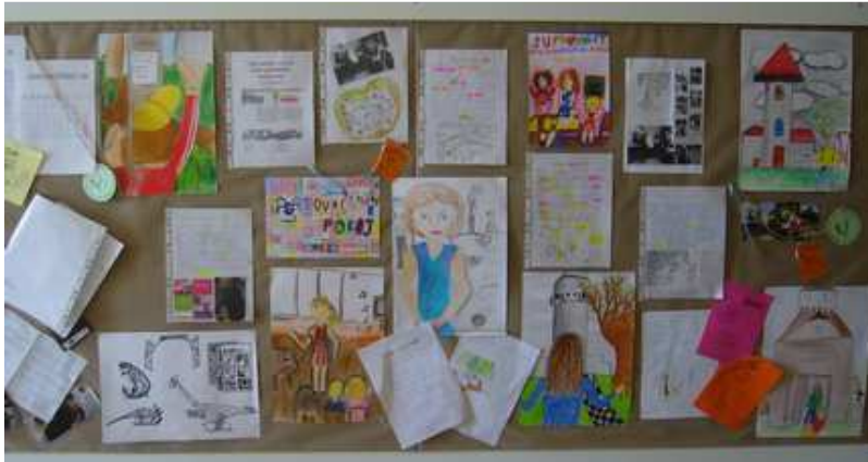
Škola v přírodě - 3. ročník