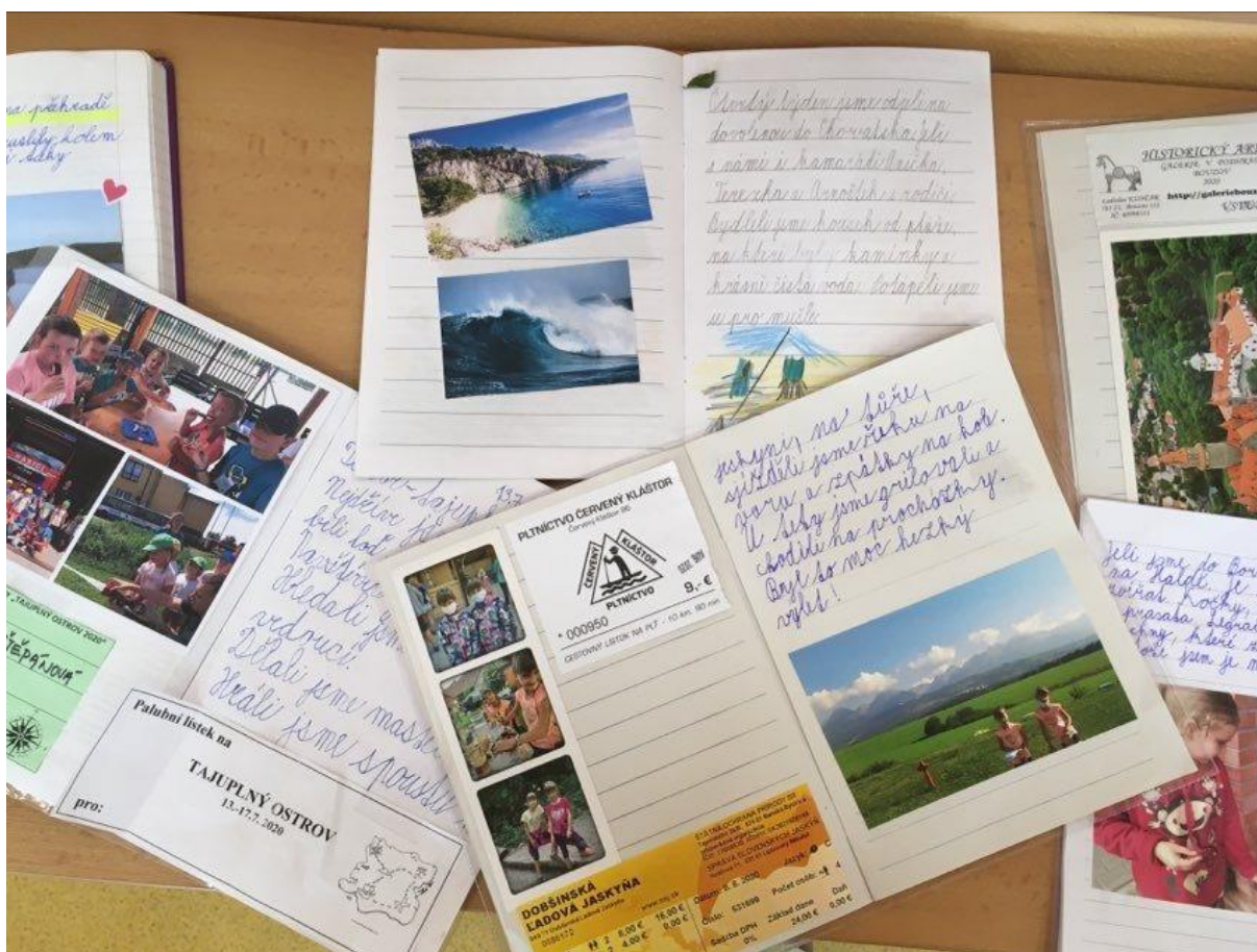
Žáci 2. A vytvořili během letních prázdnin nádherné deníky