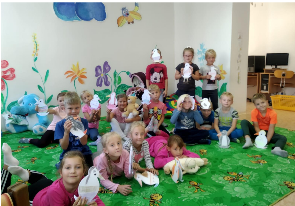
Adaptační hry v 1. B a 1. C ve školní družině